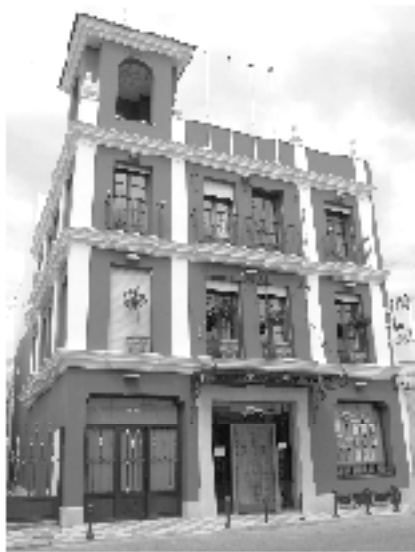
C/ La Fuente, 26